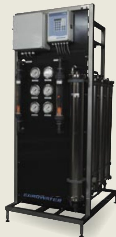
Rammemonteret CU:RO kompaktanlæg; et komplet omvendt osmoseanlæg bygget sammen med et forbehandlingsanlæg på en ramme af rustfrit stål – klar til brug.