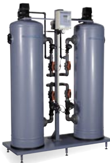
Blødgøringsanlæg type SMH 602.