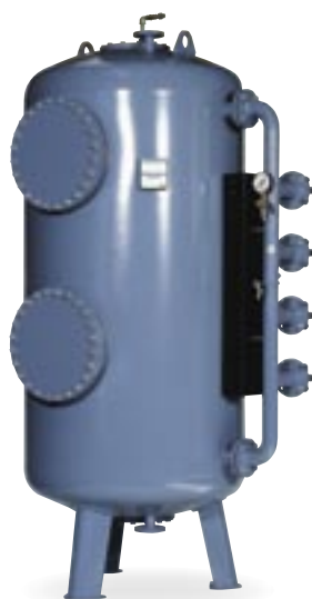
Trykfilteranlæg type TFB 14.

Analyser af vandprøver på eget laboratorium. Vandanalysen er udgangspunktet for valg af løsning.