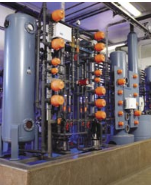
Kedelspædevand til højtryksdamppturbine på kraftvarmeværk